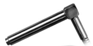
Cartouche chauffante spéciale "zamak"