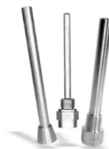
Doigts de gant Voir rubrique "Accessoires divers"

Exemple de référence pour une sonde avec une gaine de protection de 50 mm, Ø 6 mm en 1 x Pt 100 : MDOSI501-6